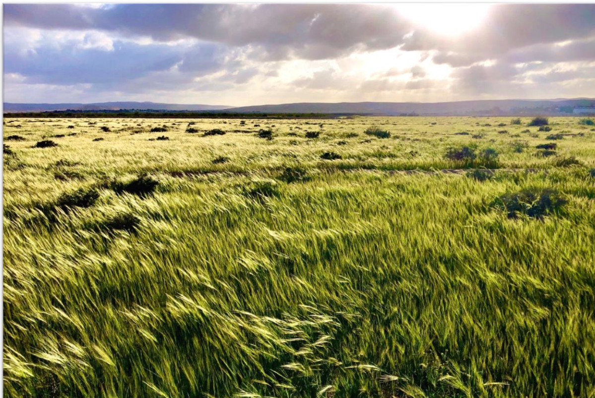
שדה צין בשיאו