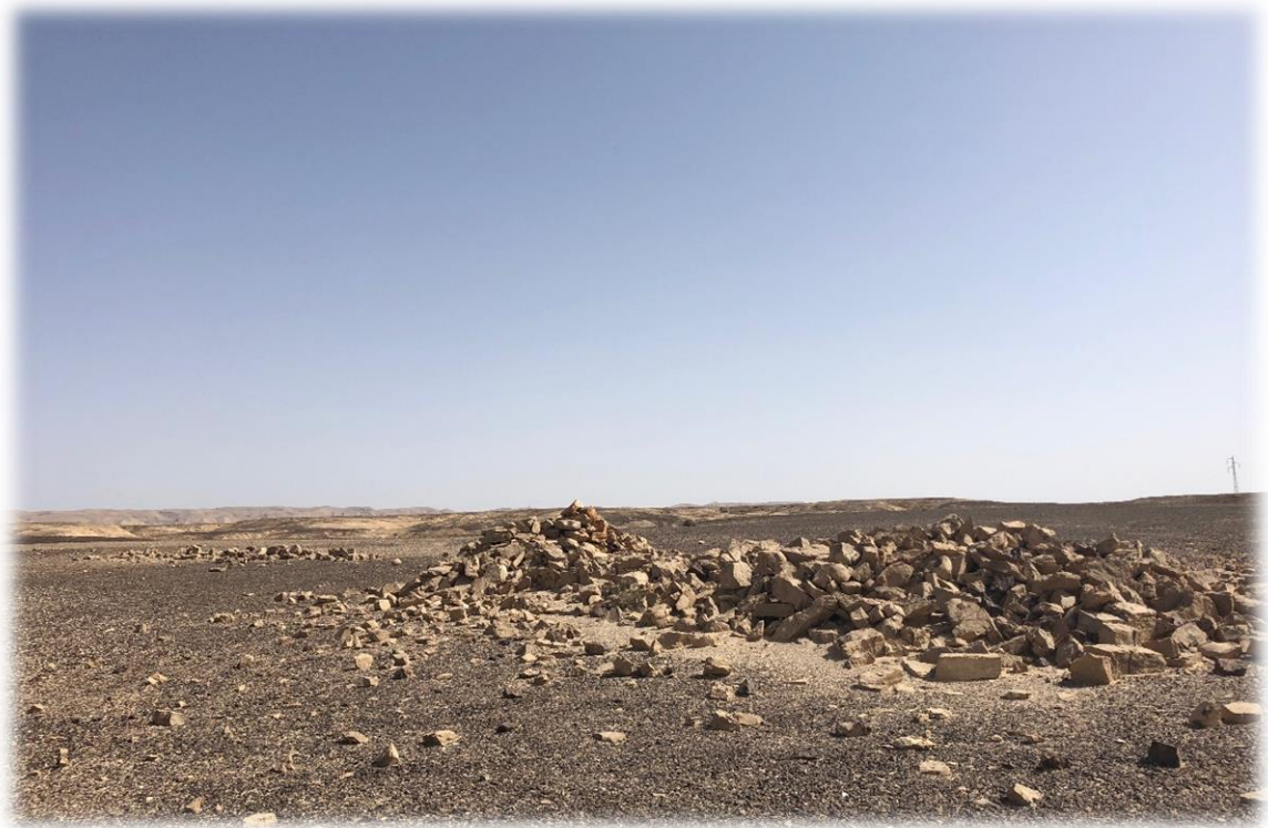
אתר נחל צינים, על תוואי ד'רב א(ל) סולטנה

דרב א(ל) סולטנה הייתה ככל הנראה אחת הדרכים הקדומות ביותר שחצו את מרכז הר הנגב. רבים החוקרים והנוסעים אשר מתארים את הדרך- מוסיל וקריק בתחילת המאה ה-20 מתארים את המצודות של 'עין ערגה'(עין עריג'ה) ו'עין רחל' (עין חארוף) ואת הדרך העולה דרך ראס מחבה אל עבר מעלה צין (נקב ע'רב). נלסון גליק סוקר את הדרך ב1959 ומדווח כי דרך זו הייתה בשימוש מרכזי בתקופה הכלקוליתית. הדרך שימשה להובלת מטילי נחושת מפונון, בין השאר, לאתרים כגון ביר אבו מטר ליד באר שבע, באר רסיסים ועוד. גליק מדווח בנוסף, כי לאורך הדרך נסקרו אתרים מתקופת הברונזה התיכונה ומתקופת הברזל. אחריו סקר את הדרך רודולף כהן, וזאת כחלק מסקר החירום שערך לפני כניסת צה"ל לנגב לקראת החזרת סיני. טלי גיני מציעה, כי ד'רב א(ל) סולטנה הייתה הדרך הקדומה בה העבירו הנבטים את הבשמים לנמל עזה. מאוחר יותר, השיירות עברו לנתיב 'דרך הבשמים' הדרומי דרך מכתש רמון.