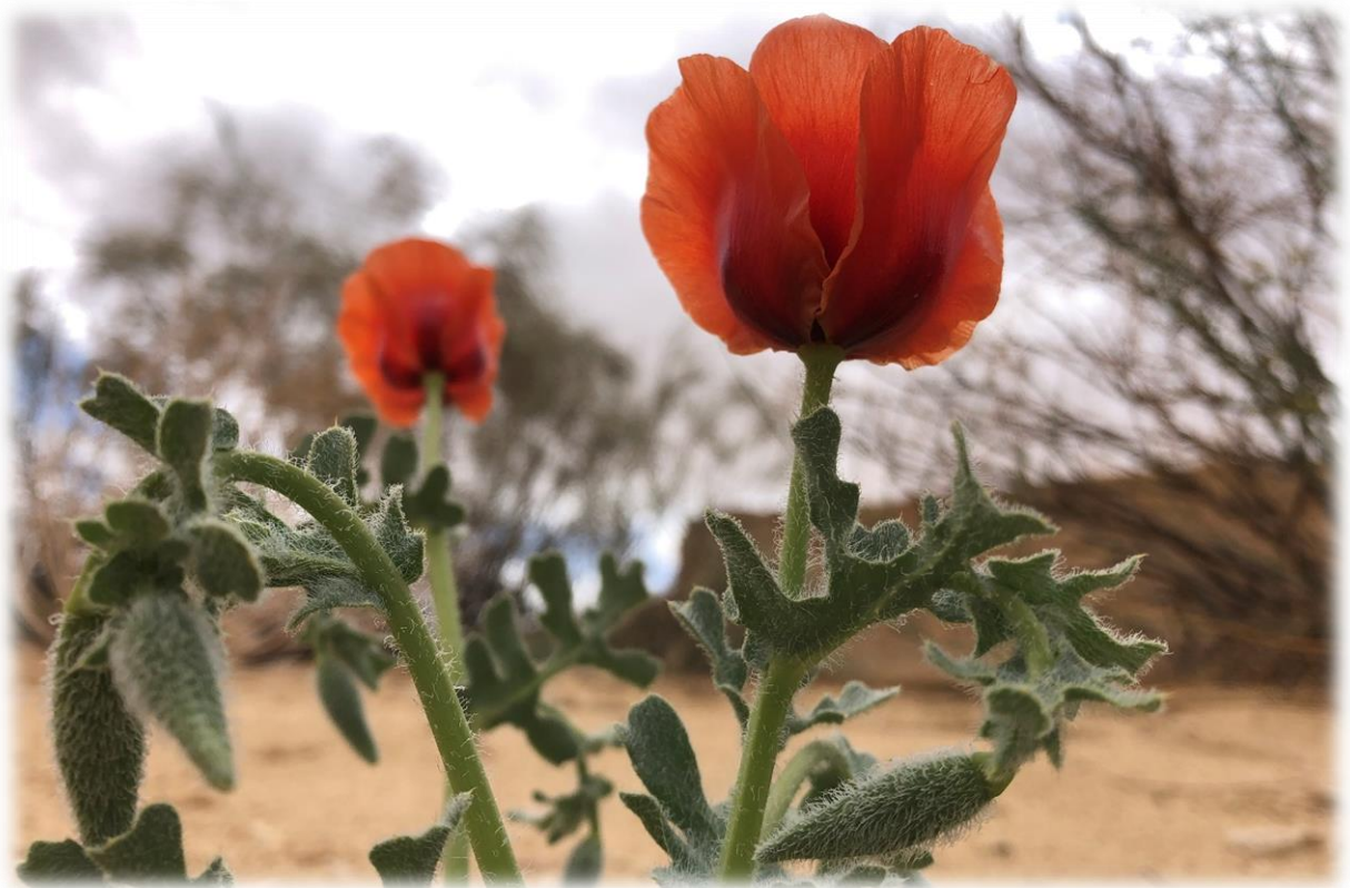
פרגה ערבית, Glaucium Arabicum