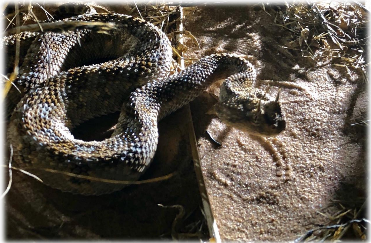
עכן גדול, דיונת באר מילכה.