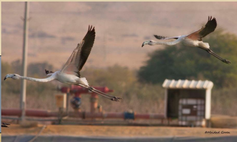
פלמנקו בתעופה