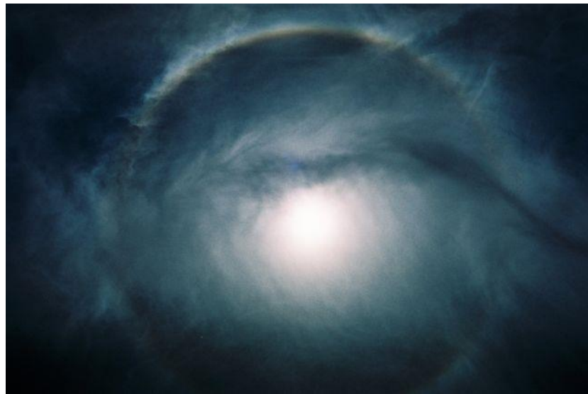
תמונה (1) הילה 22^\circ מהערבה.

תופעה פחות מוכרת אך לא פחות מעניינת נקראת "הילת שמש" ( 22^\circ halo):