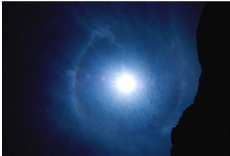
תמונה (3): הילה 22 מואדי רם שבירדן.

חדי העין יבחינו כי בתמונה הראשונה ההילה דומה מאוד לקשת בענן בתצורה מלאה (כזאת אפשר לראות רק מגובה רב, כאשר אין האופק קוטע אותה), אך יש בה שינוי אחד- צבעי ההילה הפוכים מצבעי הקשת בענן! הצבע האדום במרכז (פונה לכיוון השמש) בעוד שהצבע הסגול בחוץ. בדרך כלל ניתן להבחין רק בצבע האדום בצד הפנימי של ההילה.