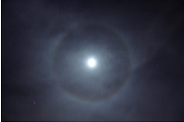
תמונה (2): הילה 22 מסביב לירח. צולמה ב-12 לינואר 2017. מעל שמי המדרשה.

חדי העין יבחינו כי בתמונה הראשונה ההילה דומה מאוד לקשת בענן בתצורה מלאה (כזאת אפשר לראות רק מגובה רב, כאשר אין האופק קוטע אותה), אך יש בה שינוי אחד- צבעי ההילה הפוכים מצבעי הקשת בענן! הצבע האדום במרכז (פונה לכיוון השמש) בעוד שהצבע הסגול בחוץ. בדרך כלל ניתן להבחין רק בצבע האדום בצד הפנימי של ההילה.