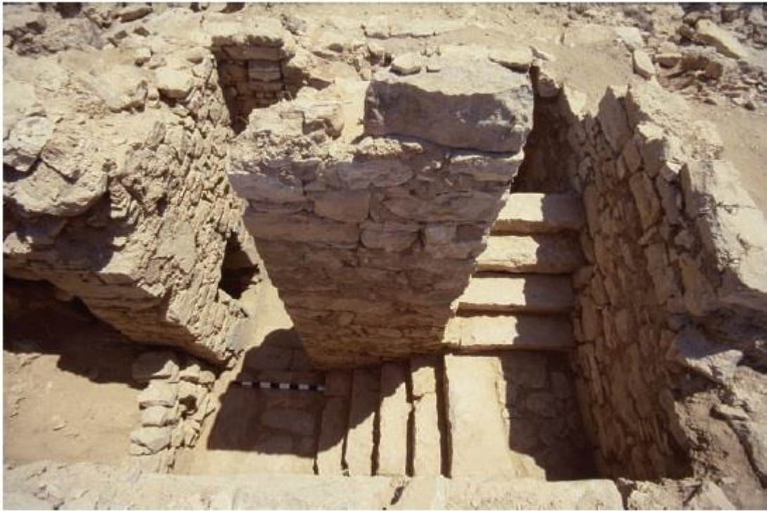
מבנה המדרגות המוביל לאמבט- חרבת מאגורה.

כי מבנה זה הינו מצד בעל ארבעה מגדלים פינתיים. אחד מהמגדלים הפינתיים הכיל חדר מדרגות אשר הוביל אל חדר מטויח ובו אמבטיה וכלים נוספים.