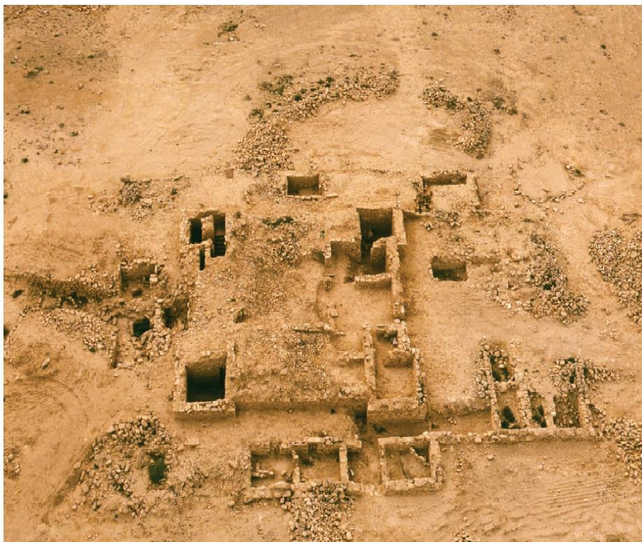
חרבת מאגורה מבט על.

ציטוט זה מספרו של יוסף בן מתתיהו פותח לנו צוהר לפרשה מרתקת בתולדות יחסי ממלכת יהודה החשמונאית לערבים/הנבטים שכניהם ממזרח. ע"פ יוספוס פלביוס, ביקש יוחנן הורקנוס לכרות ברית עם חרתת מלך הערבים בבקשה לעזרה צבאית במאבקו מול אריסטבלוס אחיו במאבק על המלוכה, ובתמורה לעזרה יחזיר לידי חרתת מלך הערבים את הערים הנבטיות שאביו אלכסנדרוס כבש מידיהו.